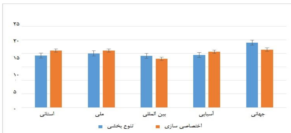
شکل ۲ مقایسه مؤلفه بسط خلاقیت در گروه های اولیه تخصصی و متنوع سازی در سطوح مختلف موفقیت ورزشی